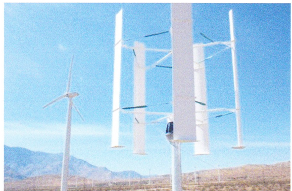
Foto: Links een horizontale as windturbine, rechts een verticale as windturbine

De bouwlocatie ligt aan de Westervoortsedijk en grenst aan de noordkant aan het spooreplacement op een afstand van hemelsbreed 1 km tot de eerste woningen in Presikhaaf 2.